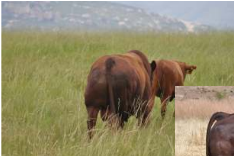
FVB 07 706 Foto Feb 2014

FVB 07 706 seun van AG 02 338 is my gunsteling bul en n pragtige dier wat sy merk op die nageslag laat. Kyk uit vir een van sy seuns by die Witteberg aanteelveiling elke Februarie!