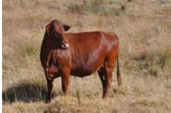
FVB 08 852 Foto Mei 2014

Haar speenindeks [7mde] was 107%, 12 maande indeks 106% en 18 maande indeks 104%