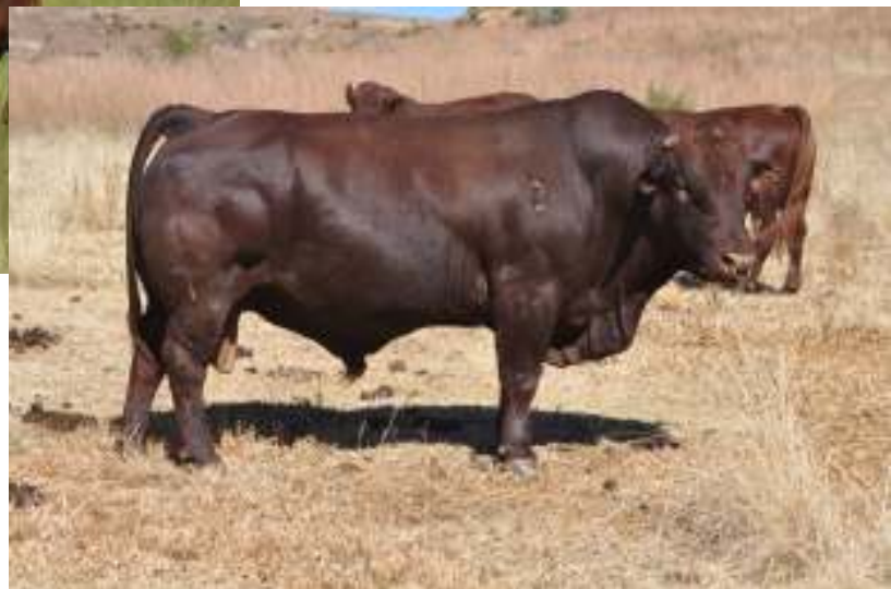
FVB 07 706 Foto Mei 2014